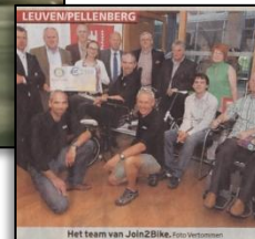
Het team van Join2Bike.